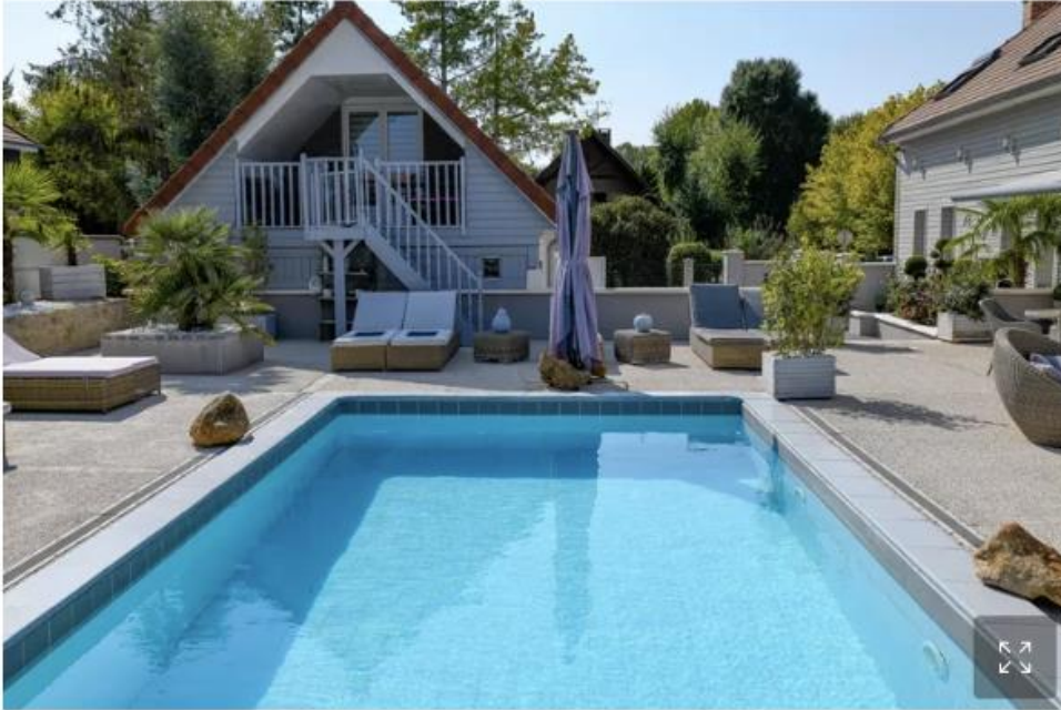
Villa de la Croix (Aube). La piscine extérieure chauffée agrément le séjour dans cette ravissante longère d'un village proche de Troyes.

5 chalets, de 125 à 145 €. 22, rue de la Croix, 10410 Villechétif, Aube (06.95.72.70.04 ; villadelacroix.com ).