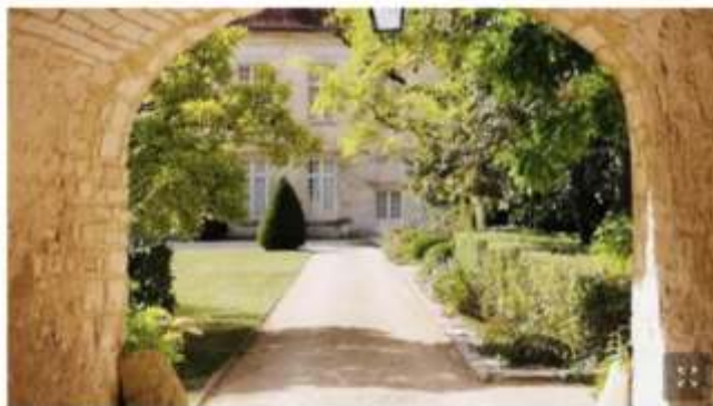
Dans l'Yonne, le château de Viviers a ouvert deux chambres d'hôtes l'an dernier. L'une des adresses à découvrir en Bourgogne.

Par Sylvie Bednar, Jean-Bernard Carillet, Guyonne de Montjou, Marine Sanclemente et Bénédicte Menu Publié il y a 7 heures, mis à jour il y a 27 minutes